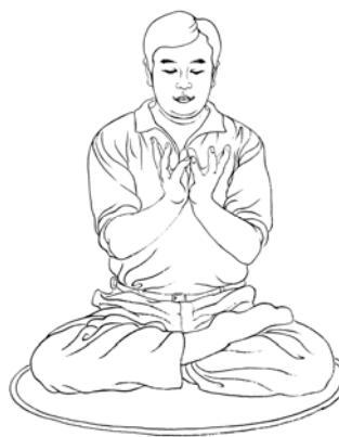
Posición mano de lian