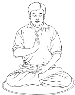
Sostener una palma recta